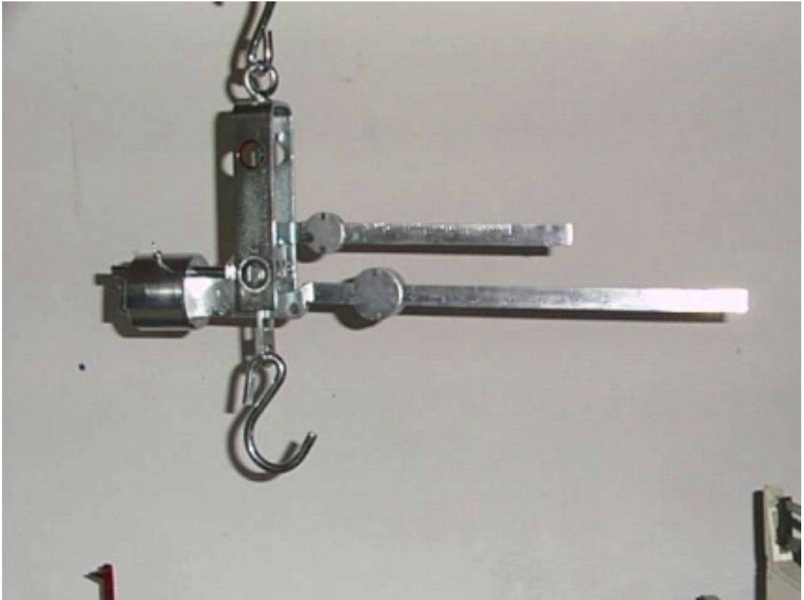
Slika 2 zaštitni žig za utiskivanje